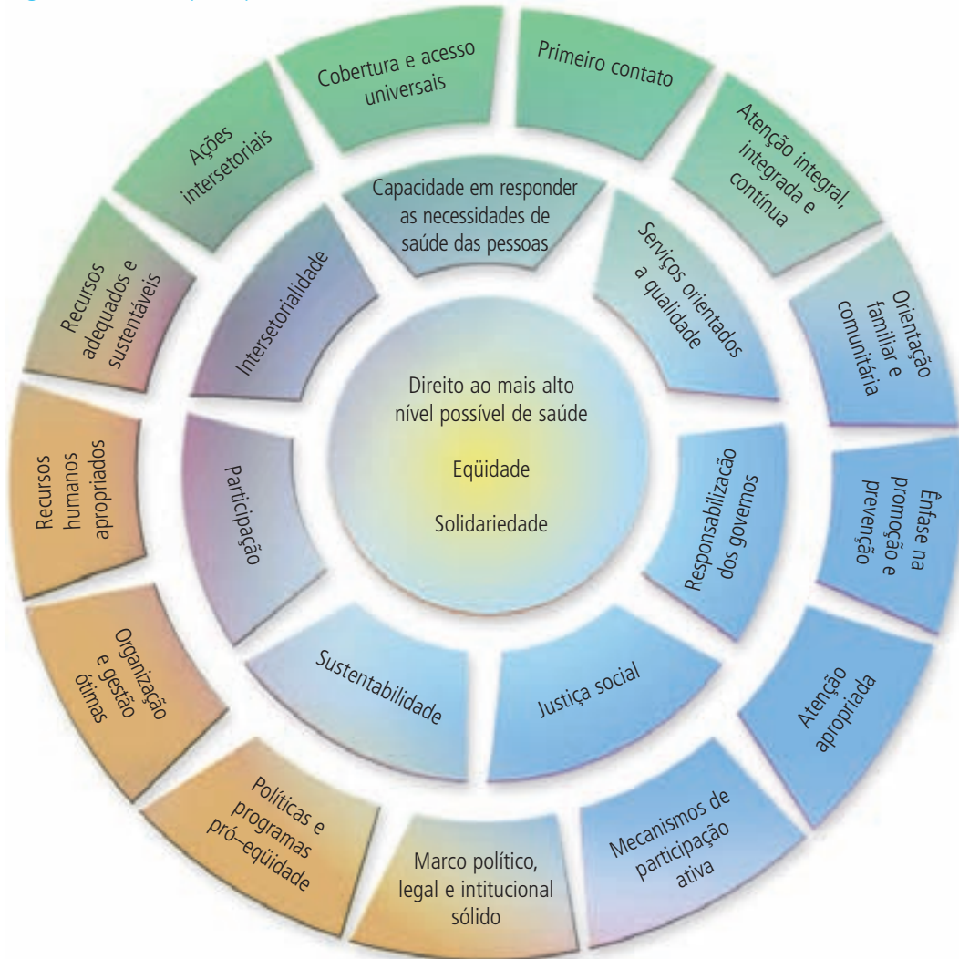
Figura 1: Valores, princípios e elementos centrais em um sistema de saúde com base na APS

O direito ao mais alto nível possível de saúde sem distinção de raça, gênero, religião, convicção política ou condição social ou econômica está expresso em muitas constituições nacionais e articulado em tratados internacionais, incluindo a carta da Organização Mundial da Saúde 40 . Significa direitos legalmente definidos dos cidadãos e responsabilidades do governo e de outros atores, bem como cria demandas de saúde para os cidadãos que irão reivindicá-las quando não forem cumpridas. O direito ao mais alto nível possível de saúde é instrumental ao assegurar que os serviços sejam receptivos às necessidades das pessoas, que haja responsa-